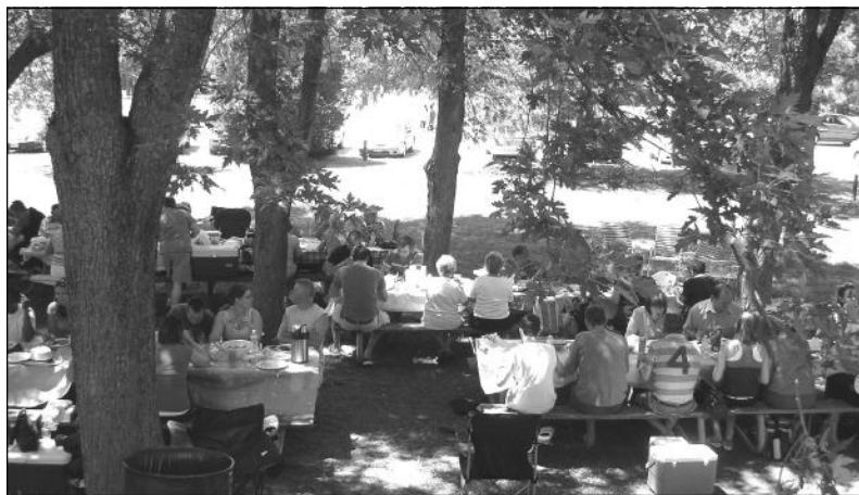
Полудзенок прешол у солидним хладку под корунами древох недалеско од павильона

та ше пририх-товане за гощину цалком порядне покончело. Вельки шор ше формовал кед почал пикнику, коло 70-75 души. Кед полудзенок и прировнаме и гу прешлому року, дзе следоване прашецини и присутних – тото число було ище р и ж н и х менше. Правда, уж у дньох пред шалатох. Єден час ше слабо и наших приселенцох, место на пикник, бешеду чуло, пойдзе на якешик камповане. И так, кезде мал му-д р е й ш е й р о б о т и ,