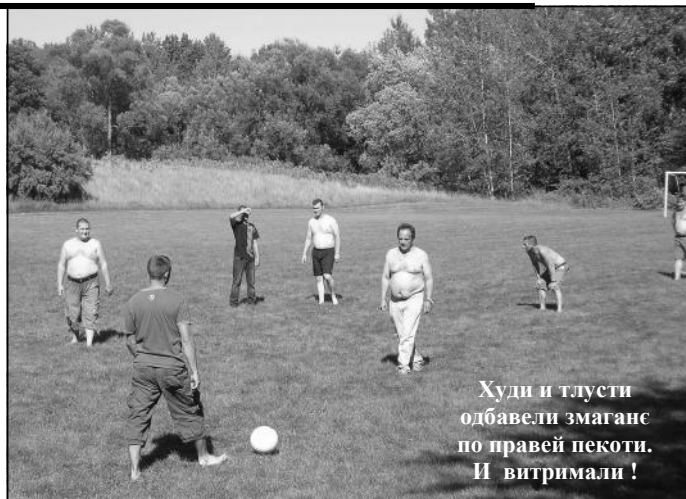
Худи и тлусті одбавели змаганє по правей пекоти. И витримали!

анализа указує же од тих 43 кед достали праву потенциялних, на пикник пришли 21 інформацію. фамелия а не пришли 22 фамелії (од Понеже бу- тих цо ходза). Або, з Киченерского ло наисце мало подруча на пикник не пришли 37 дзедох не отримани фамелії а 21 пришла. 3 того угла кед ніяки спортски и ше патри вец и сам наслов того напису забавни бависка за не богзна як точни. Не добра зрозмира, ніх, старши (худи и у каждым случаю. Камповане досц брухати) отримали одмогло у цалей ствари. Кед же то так, едно солидне фод- кед же ше кампує з нагоди каждого Дня Ц (ми им зоз хладку Канади, вец би вироотно було ніч не завидзели на мудрейше преложиц пикник тидзень познейше. Мали бизме 12-14 фамелії спортским елану док вецей, мож предпоставиц. А то не мала зме навияли). Углав- ствар. Лем зоз Киченеру и Вотерлуа ном, час ше тельо вецей. Розуми ше, даскелі пополнивало у фамелії зоз Онтария були и у нащиви друженю у хладку под древами и у старому краю, лето час за таки рижних приповедкох. После 6 путованя. Не знаме чи було з наших и пополадню даедни почали одходзиц, на Куби дакого, таки деталі не були але добра часц ше затримала аж до пол розполаганю. И того року ме волали дзевятей кед ше сход обачліво осипал. пар старши фамелії (хтори не маю Бул уж час одходзиц дому. имейл адресу, односно компютери), же Наздавайме ше же того року кеди будзе пикник. И були на пикнику, Єшенські пикник будзе векши як цо